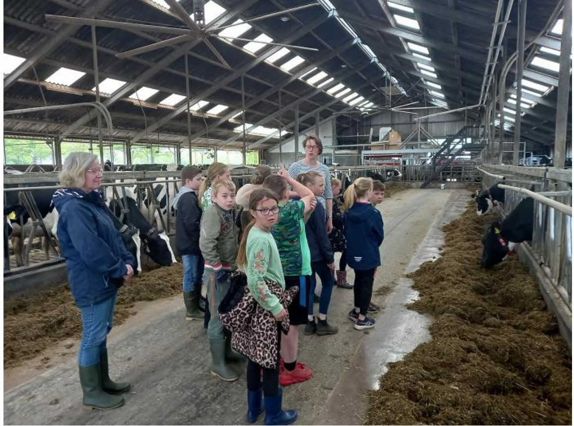
In de stal bij de melkkoeien en aan het eind van de stal de melkrobot. De boerin vertelt over het vee.