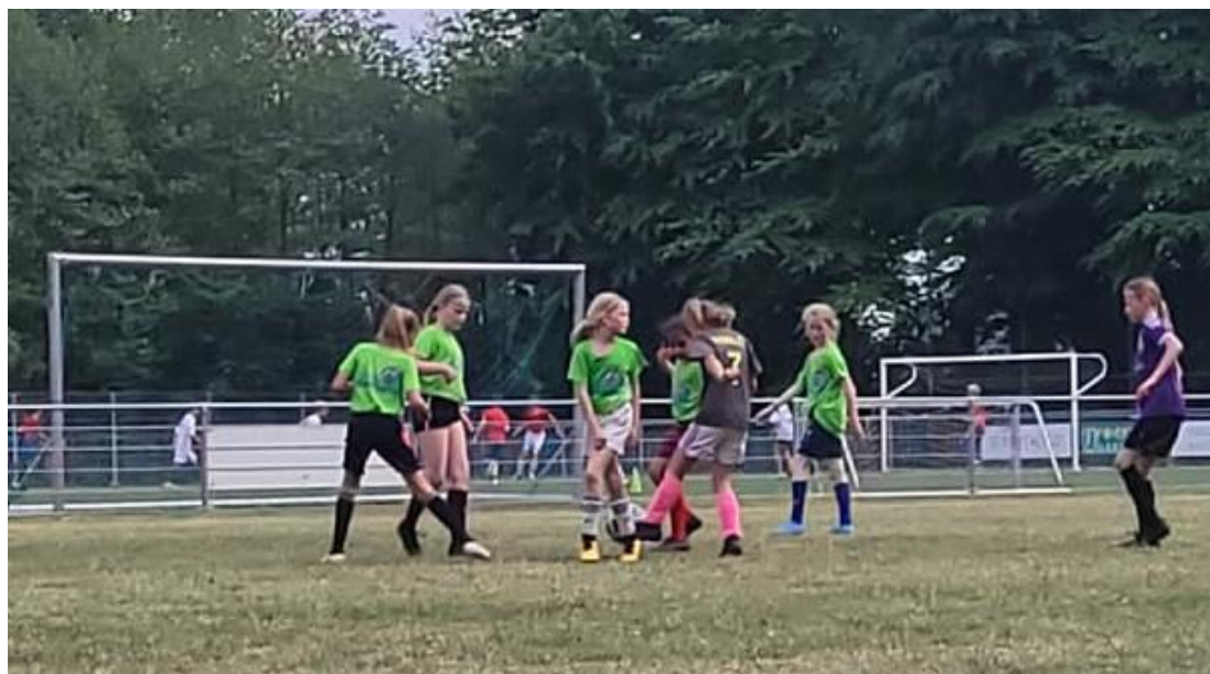
De meiden in actie