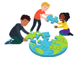
We dragen allemaal een steentje bij